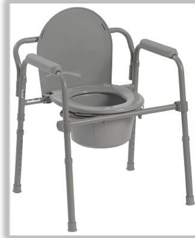
Silla 3 en 1 Ducha-Modo