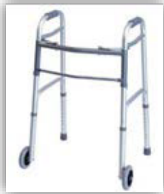
Andador de ruedas delanteras