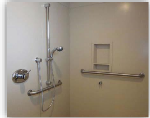
Barras de agarre y extensión de cabezal de regadera

Muy recomendables pero NO cubiertos por seguros.